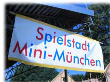
※ 「ミニ・ミュンヘン研究会」より URL: http://www.mi-mue.com/

「KBC タウン」はドイツで 30 年以上の歴史を持つ「ミニ・ミュンヘン」をモデルに考案されました。「ミニ・ミュンヘン」とは、7 歳から 15 歳までの子どもが 3 週間限りの「小さな都市」を築き上げ、その運営を行うイベントで、2 年に一度、ドイツのミュンヘン市で開催されます。子どもたちは都市生活に必要なとされる様々な職業を疑似体験して所得を得、納税や市政も行うことにより、街や社会の仕組みを学びます。現在、日本でも千葉県佐倉市、千葉県市川市、三重県四日市市、福岡県福岡市などの自治体が主催しており、教育プログラムとして全国で広がりつつあります。