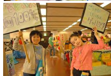
▲受付の様子(上) ▲会場内での宣伝の様子(下)