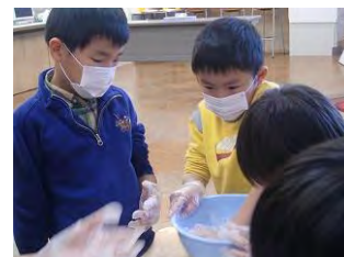
▲食品ブースのリハーサルの様子