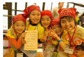
▲模擬店の CM タイム(上) ▲表彰された子どもたち(下)

今年の装飾テーマは「地域と流通」。 この日のために子どもたちが作り上げたパネルが会場内を飾ります。 心を込めた装飾が会場内に溢れる様子は大人も圧巻です。