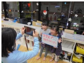
カメラマンや監督、出演者は誰にするかなど相談し決定。撮影も子どもたち自身で行いました。