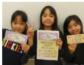
3タイプのケビィの中から、好きなデザインを1つ選んで投票しました。