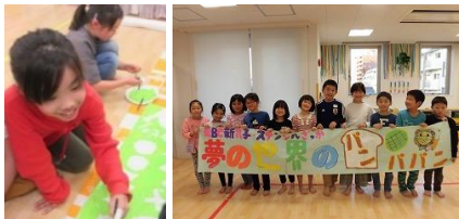
▲目立つように大きな看板を作成。一人で作るの大変だけれど、お友達と協力して頑張ります！

KBCタウン当日はたくさんのライバル店が出現。目立つように看板の配色を工夫したり、お店のテイストに合わせた装飾を作成。また商品を手に取りたくなるような展示・陳列などディスプレイ作り全般をみんなで力を合わせて行います。