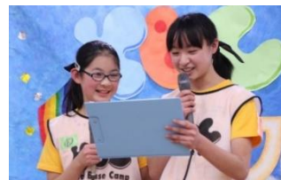
開会式・閉会式の司会進行、ステージで行われるCMタイムのサポートMCを務めました。