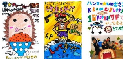
▲会場内に掲示するポスターは場所や値段を記載。ブースの内容や魅力が伝わるように仕上げます。

広告プランでポスターを出稿することにしたお店は掲示される場所にあったポスターの内容を検討。また当日はステージで2分間のCMタイムも実施。一生懸命練習したセリフやダンスでお客様にアピールします。