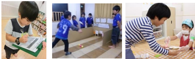
接客やオペレーション、ブース位置やお客さんの導線、声掛けの仕方などの他にも、商品のクオリティチェックや回転率などを確認しました。チェック項目に書かれているポイントを見てブースのお友達に指示を出したり、今までの経験を活かした的確なアドバイスを行いました。