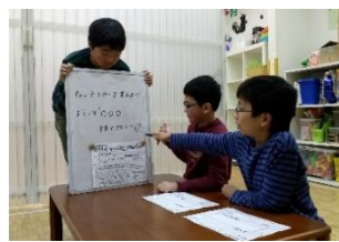
実行委員から集まったキャッチコピーをもとに、キーワードを抜粋して組み合わせ、最終的に島根社長も加わりその年のテーマを決定します。