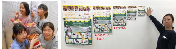
▲おいしさが伝わるかな？ ▲ポスターはどの大きさにしようかな？

世の中の広告料金は、出稿時期・内容・エリア・回数などによって決まります。KBCタウンのポスターも掲示する枚数やサイズを子どもたちが決めます。「広告を出稿してみんなの注目を集めたい」「事前広告は少なく、当日の営業活動を頑張る」など自分たちでの戦略を立てます。