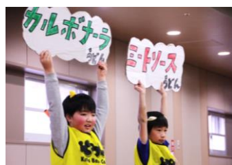
▲盛り付けや渡し方も研究。