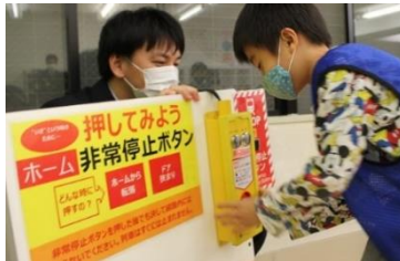
▲駅員さんによる「安全教室」。電車の乗り方、マナーや駅員さんのお仕事について学習。緊急時に使う「非常停止ボタン」も初めて押してみました。

東急電鉄株式会社との協力のもと、「電車に関わるお仕事を知ろう」をシリーズで実施。1つの会社にもたくさんの職種があることを知り、幅広い視点で考えるきっかけとなることを目指します。『電気司令所』現場で活躍する「プロ」に裏側のヒミツを教えていただきました。