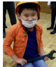
▲点検や修理で使う大きなスパナ、そしてキッズ用の作業服をお借りし、気分は作業員！