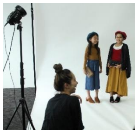
▲ショップスタイリスト体験。テーマにあったおしゃれなスタイリングに挑戦。最後はモデルとなり写真撮影会を実施。