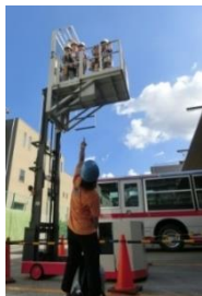
▲高所作業車に乗り、バスの点検作業を体験。