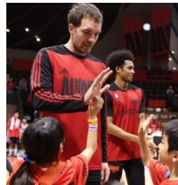
▲アルパルク東京の試合観戦。観戦前には試合運営の職業体験。さらにはコートに降りて選手とハイタッチやインタビューも！