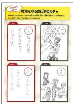
▲「電車を守るお仕事カルタ」を作成。「ルールを点検、電車を守る かけのヒーロー」など学習内容が反映されました。

東急電鉄株式会社との協力のもと、「電車に関わるお仕事を知ろう」をシリーズで実施。1つの会社にもたくさんの職種があることを知り、幅広い視点で考えるきっかけとなることを目指します。『電気司令所』現場で活躍する「プロ」に裏側のヒミツを教えていただきました。