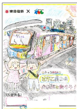
▲『電気のお仕事』など毎月様々な部署のお仕事を学習。学習内容は「マスターノート」にまとめました！