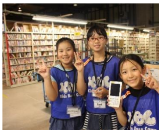
▲ブックオフの物流センターに潜入。注文してから商品が届くまでどんな仕組みになっているのか教えていただきました。