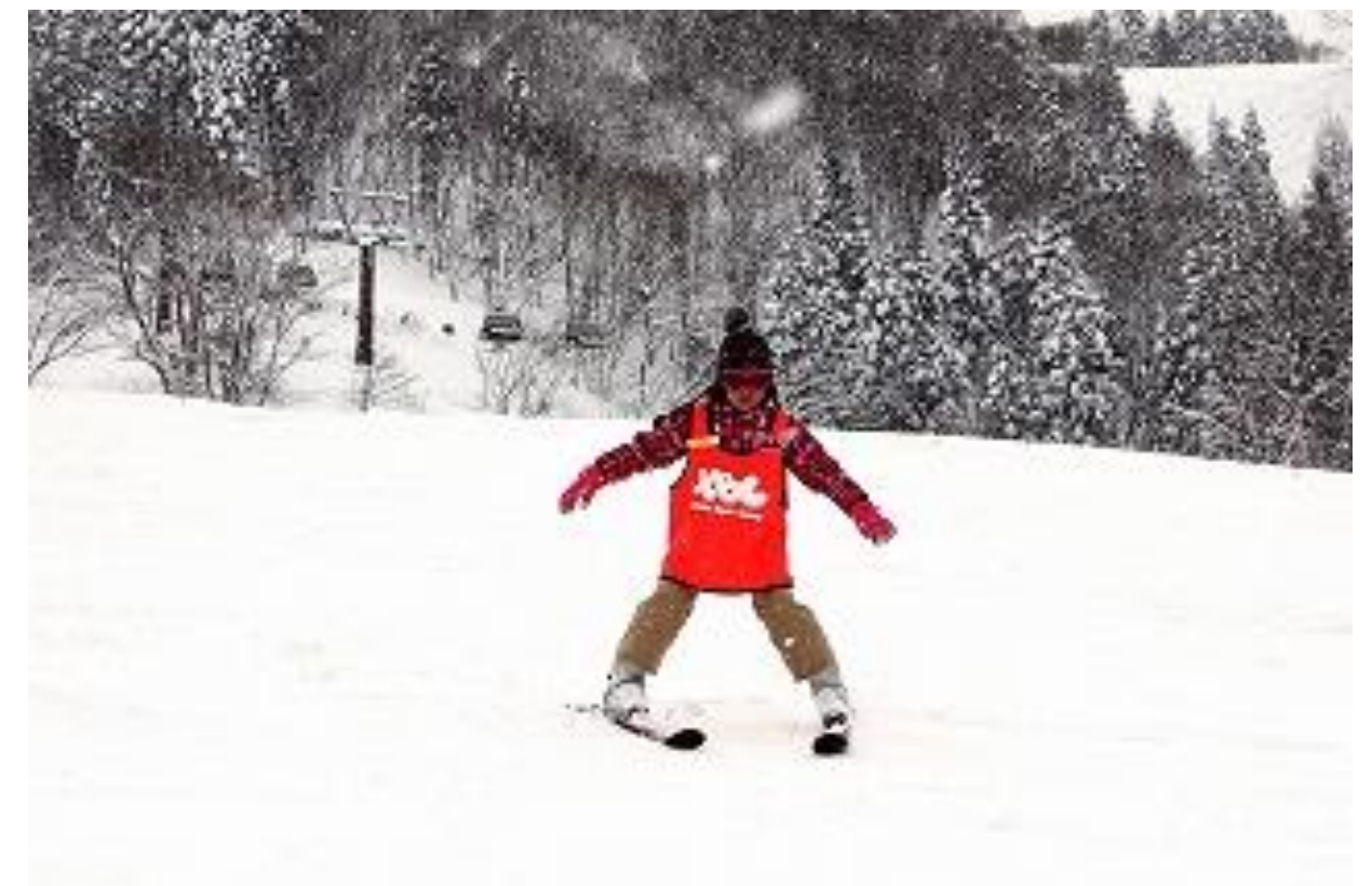
▲みんなの声援に勇気をもらいます。