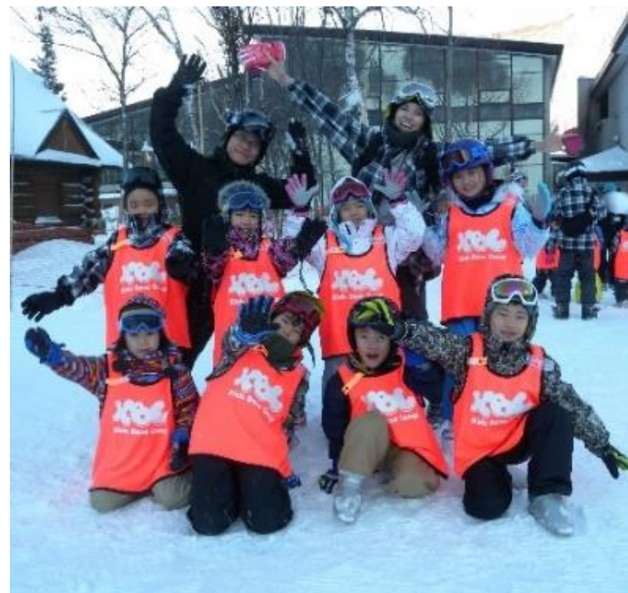
▲あっという間に仲良しに♪